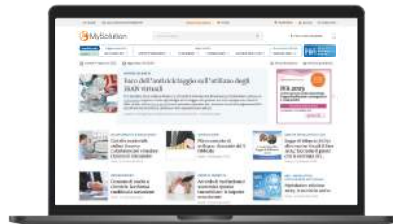
QUOTIDIANO FISCO & SOCIETÀ